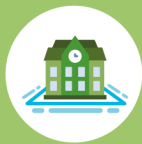
figure professionali rigidamente determinate, ciò è tanto più vero per il nostro Istituto, in cui si richiede di mettere al centro del processo formativo una significativa apertura interculturale, una forma mentis flessibile e versatile e una buona capacità progettuale, in risposta alla nostra realtà territoriale.